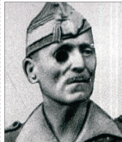
JOSÉ MILLÁN ASTRAY ¿No creen que tuerto, manco y con la mala leche que gastaba podría ser un personaje de 'Walking dead'? (Foto sin aplicación ZombieBooth)