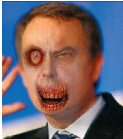
JOSÉ LUIS RODRÍGUEZ ZAPATERO El presidente del Gobierno español encuentra una sangrienta manera de acabar con la preocupante crisis económica que padecemos.

algunas de las personalidades satirizadas en 'Una, grande y zombi'