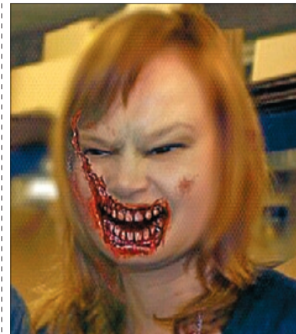
LEIRE PAJÍN Es la segunda víctima, tras Alfredo Pérez Rubalcaba, del zombi Zapatero. El autor ajusta cuentas con la ministra por la polémica de 'Todas putas'.