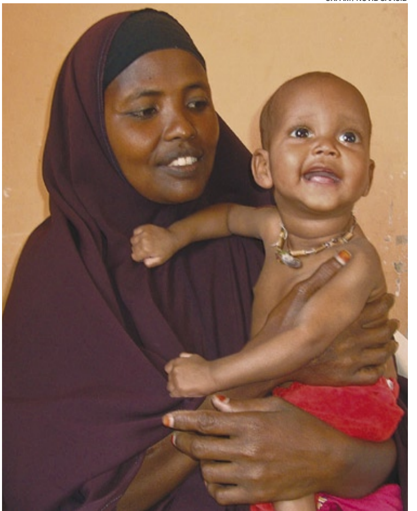
SALVADO EN SEIS SEMANAS. Una mujer somalí posa con su hijo afectado por la hambruna y luego sanado gracias a la ayuda internacional.

Turistas exóticos... y ricos Rusos, brasileños y chinos son los visitantes que más gastan en Barcelona COSAS DE LA VIDA ▶ Páginas 50 y 51