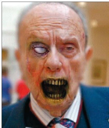
MANUEL FRAGA Piense el lector en la forma de hablar del veterano político, en Palomares y en su célebre frase «la calle es mía» e imagínenlo en un mundo zombi.